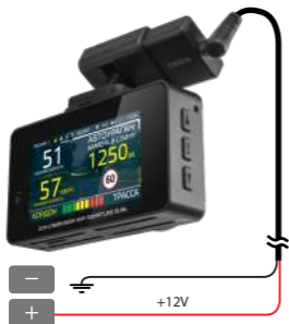
Схема подключения адаптера питания iBOX 24H Parking monitoring cord S12 к бортовой сети автомобиля на примере комбо-устройства:

Адаптер питания iBOX 24H Parking monitoring cord S12 позволяет не допустить критической разрядки аккумулятора автомобиля. В каком бы режиме ни работал видеорегистратор, адаптер автоматически отключает его питание, при падении напряжения ниже 12,0 В для аккумуляторов с напряжением 12 В и ниже 23,2 В для аккумуляторов с напряжением 24 В.